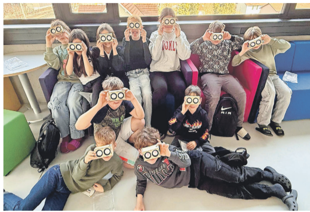
Stolze Besitzer der selbst zusammengebauten Musikbox.